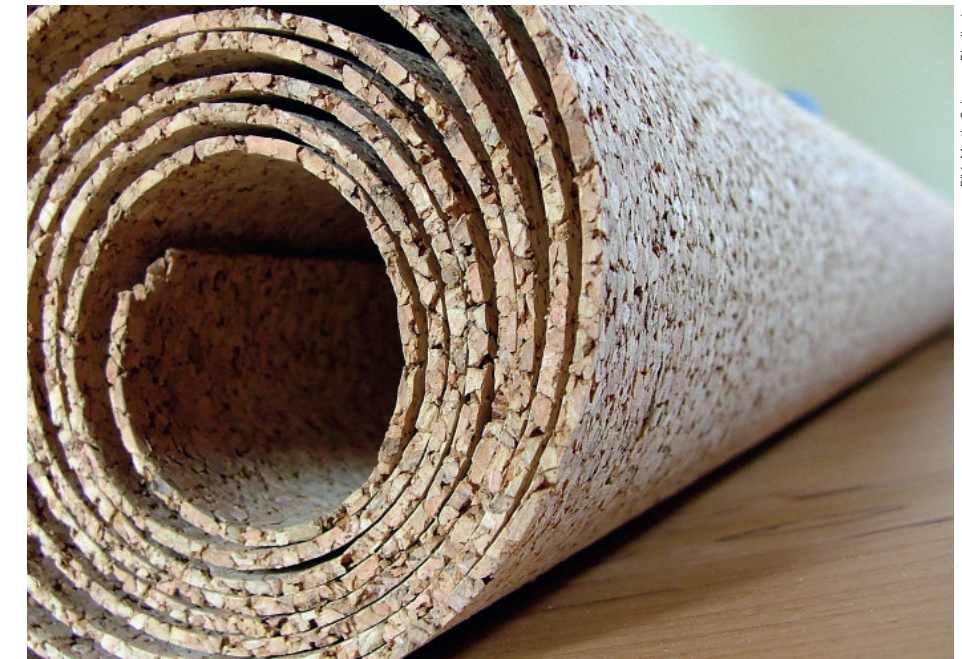
Korkbahnen eignen sich besonders gut zur Wärme- und Trittschallisolation von Fussböden.

Kork bildet die Basis für eine Vielzahl von Industriezweigen. Die europäische Korkindustrie produziert jährlich rund 340 000 Tonnen Kork und gibt 30 000 Menschen Arbeit. Ein beachtlicher Teil des Rohstoffs, rund 70 Prozent, wird für die Herstellung von Korken für Wein- und Champagnerflaschen verwendet. Neben der Nutzung als Dämm- und Isolationsmaterial sowie als Boden- oder Wandbelag im Ausbau kommt Kork aber auch in der Modeindustrie, für Möbel und in der Geschenkartikelproduktion zum Einsatz. Und selbst vor High-Tech-Einsätzen wird nicht haltgemacht: Kork befindet sich unter anderem auch in der Nutzlastverkleidung der Ariane-Trägerrakete. (cb)