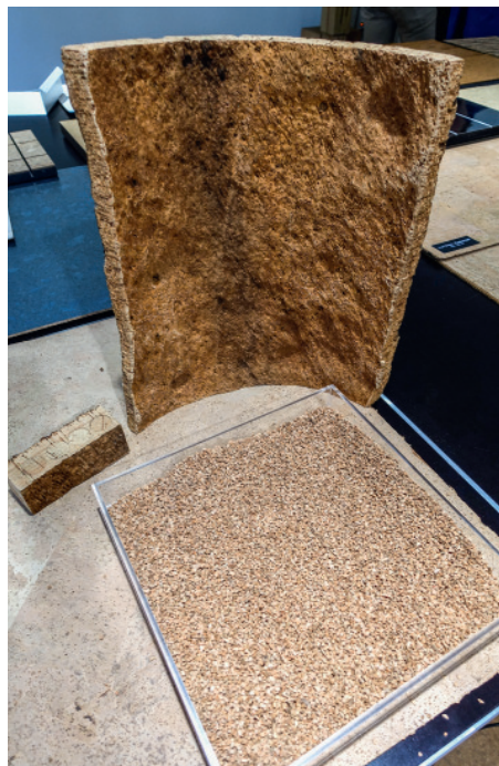
Die Rinde der Korkeiche und Kork-Granulat, das zu verschiedenen Produkten weiterverarbeitet wird.