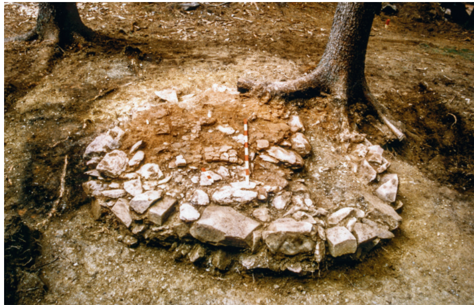
Nah bei den Stollen standen zu Zeiten von Humboldts Röstöfen, mit denen das Erz mürbe gemacht und Schwefel ausgetrieben wurde. Gold liess sich so leichter vom Quarz trennen (Bild: Fundamentreste).