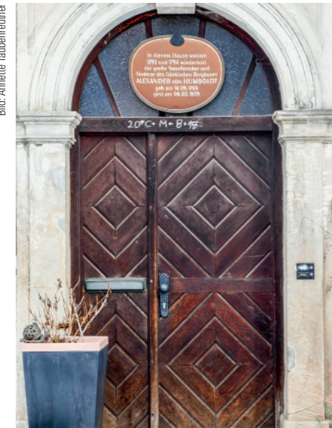
1793 und 1794 wohnte von Humboldt wiederholt in Goldmühl, wie auf der Gedenktafel steht.

unter demselben Namen gegründet, die noch etwa 40 Kilogramm Gold im ehemaligen Grubenbereich hätte lösen sollen. Da alle Schächte unterdessen mit Wasser gefüllt waren, wäre die Wiederaufwältigung zu teuer gewesen und der Berg-