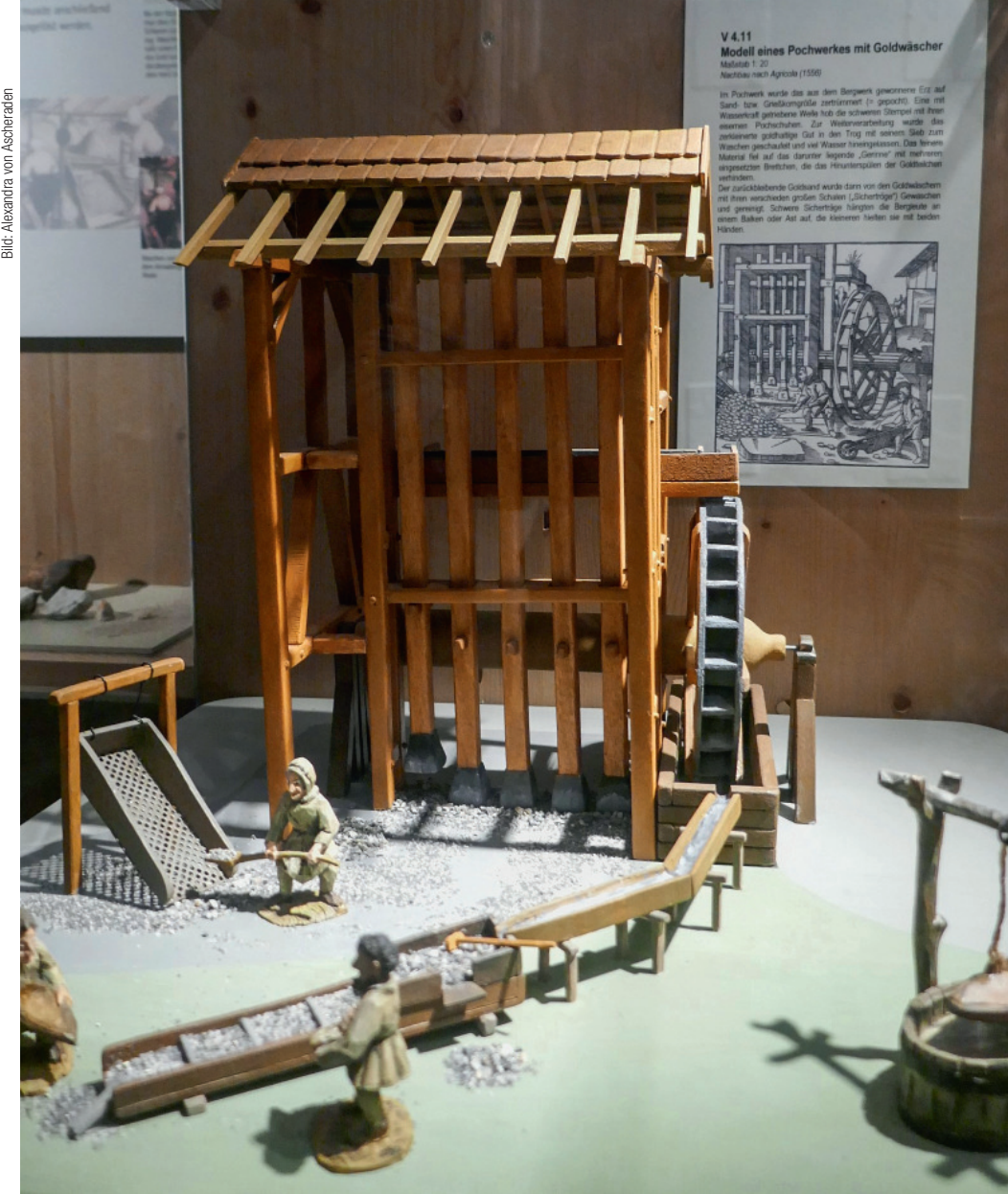
Im Pochwerk wurde Erz auf Sandkorngrosse zerkleinert (Modell). Mit Wasserkraft betriebene Wellen hoben schwere Stempel mit eisernen Pochschuhen hoch. Dann wurden die Goldkörner ausgewaschen.

Noch im Herbst 1793 hat von Humboldt ansehen müssen, dass seine Bergleute Schwefelkies als