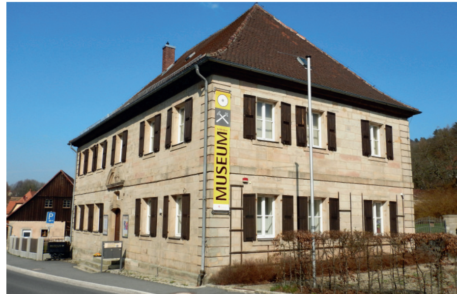
In der ehemaligen Försterei in Goldkronach übernachtete von Humboldt regelmässig auf seinen Inspektionsreisen. Heute ist in diesem historischen Gebäude das Goldbergbaumuseum untergebracht.

1861 wurde der Bergbau in Goldkronach eingestellt. 1920 wollte die Aktiengesellschaft «Fichtelgold» nochmals einen Versuch in der FürstENZECHEN wagen, musste aber 1925 Konkurs anmelden. 1933 wurde wiederum eine Gesellschaft