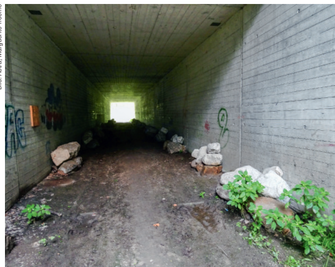
Ertüchtigung einer bestehenden Unterführung an der A2 mit Versteckmöglichkeiten und Strukturen für Amphibien und Kleintiere (links). Rechts ein Negativbeispiel am Viaduc de Galmiz: Die Präsenz des Menschen macht die Passage für grössere, störungsempfindliche Wildtiere wie Hirsche fast nicht nutzbar.

Es müssen nicht immer teure Wildtierbrücken sein. Bestehende Querungsbauwerke wie Brücken, Gewässerdurchlässe oder Unterführungen können, richtig ausgestattet, den Wildwechsel ermöglichen. Trocmé berichtet: «Wir haben insgesamt 4474 Bauwerke auf ihre Tauglichkeit für das Wild untersucht. 65 Prozent davon haben Poten-