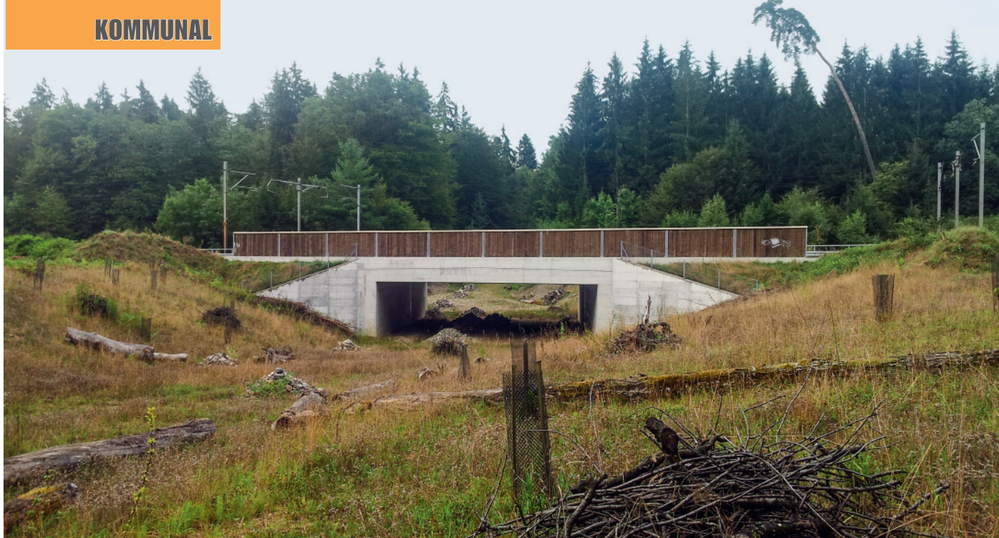
Die Unterführung «Surhard» nach der Verbreiterung: Natürlicher Boden und die strukturreiche Gestaltung mit Verstecken erleichtert den Wildtieren die Querung.

Wild muss also kaum gelenkt werden.» Kleinere Säuger und Raubtiere akzeptierten die Passage schnell. Rehe waren zögerlicher und querten erst, als es gelungen war, mit Hinweistafeln Spaziergänger von der Querung abzuhalten. Allerdings wurde bei einer Nachuntersuchung nach zehn Jahren festgestellt, dass die Brücke, da sie so schmal ist, nach wie vor nur vom ansässigen Rehwild genutzt wird. Hinweise auf wandernde Tiere fehlen bislang. Hingegen konnte einmal nachgewiesen werden, dass ein Rothirsch zwar den Weg zur Brücke fand, diese dann aber nicht querte.