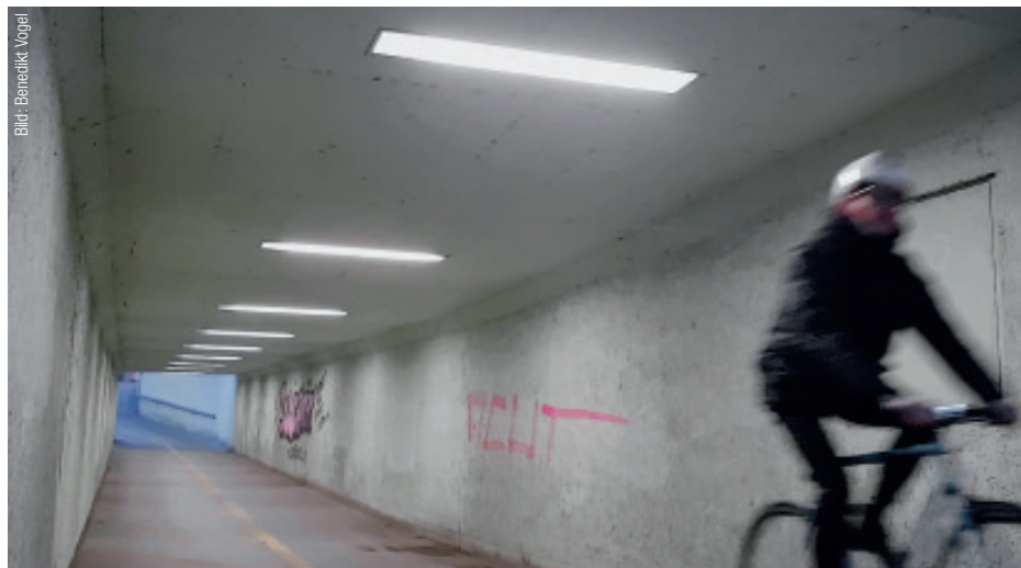
Hat der Velofahrer die Unterführung durchquert, senken die LED-Röhren ihre Leistung auf 20 Prozent.