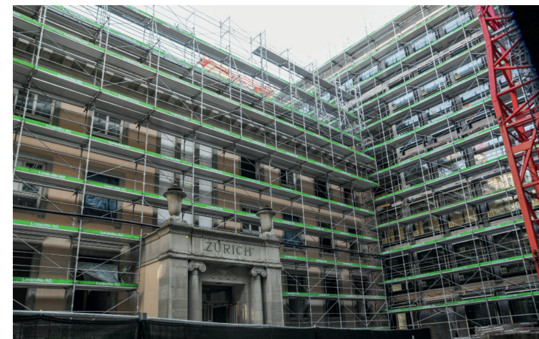
Alt neben neu: Im zentralen Verwaltungsgebäude, dessen ionische Säulen an einen Tempel erinnern, befanden sich die ersten Grossraumbüros der Stadt.

muss zeigen, dass er die Anforderungen im Betrieb erfüllt, wobei auch die Aussenräume in die Betrachtung einbezogen sind.»