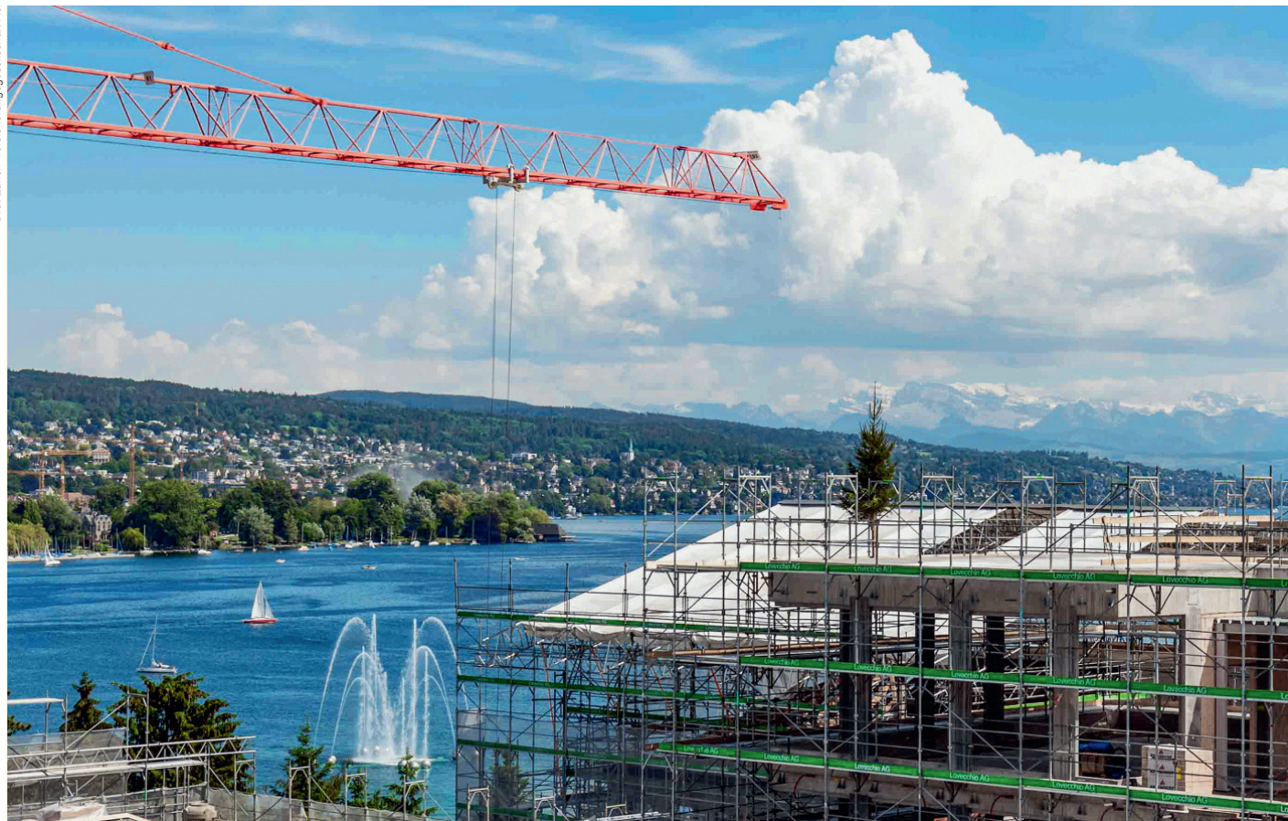
Blick auf die Alpen, die Goldküste, den Zürichsee samt Fontäne und das Tannenbäumchen vom Aufrichte-Fest: Der Hauptsitz der Zürich Versicherungsgesellschaft AG am Mythenquai liegt ebenso verkehrsgünstig wie idyllisch und wird in Zukunft Arbeitsplätze von höchster Qualität bieten.