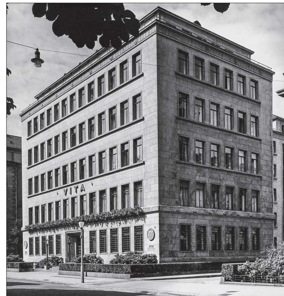
Ebenfalls denkmalgeschützt: Der 1932 errichtete Hauptsitz der Vita Lebensversicherung AG, einer Tochtergesellschaft, die im Jahr 1922 gegründet worden war.