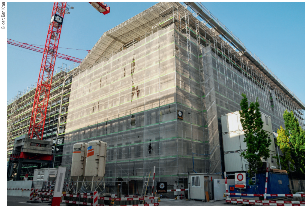
Die Rückseite der Baustelle an der Alfred-Escher-Strasse: Die Kombination aus Sanierung und Neubau, noch dazu mit den Erfordernissen von drei unterschiedlichen Nachhaltigkeits-Labels, erfordert ein Höchstmass an umsichtiger Planung, ständiger Qualitätskontrolle und Sorgfalt bei der Ausführung.

Zudem umfasst das 2000-Watt-Arealzertifikat den ganzen Lebenszyklus eines Gebäudes, bis hin zum Rückbau und der Entsorgung der Materialien. «Das Label hört auch nicht bei der Fertigstellung auf, nach der man dann eine schöne Plakette am Gebäude anbringen kann. Der Bauherr