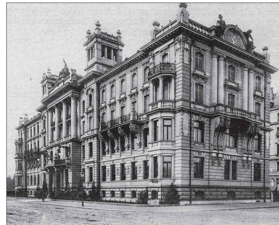
Historische Pracht: Der klassizistische Hauptsitz der Zürich Versicherung, hier eine Aufnahme aus dem Jahr 1905, wurde 1901 vollendet und befindet sich direkt gegenüber dem Mythenquai am Zürichsee.