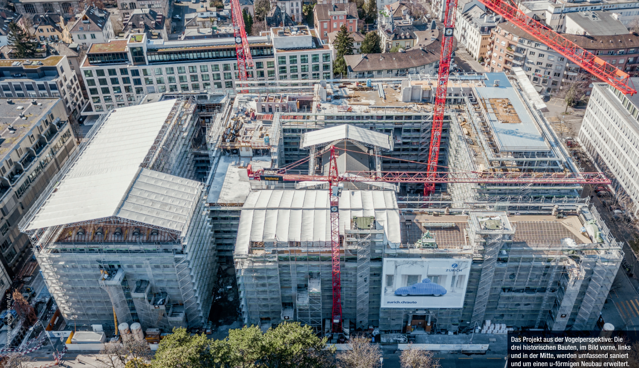
Das Projekt aus der Vogelperspektive: Die drei historischen Bauten, im Bild vorne, links und in der Mitte, werden umfassend saniert und um einen u-förmigen Neubau erweitert.