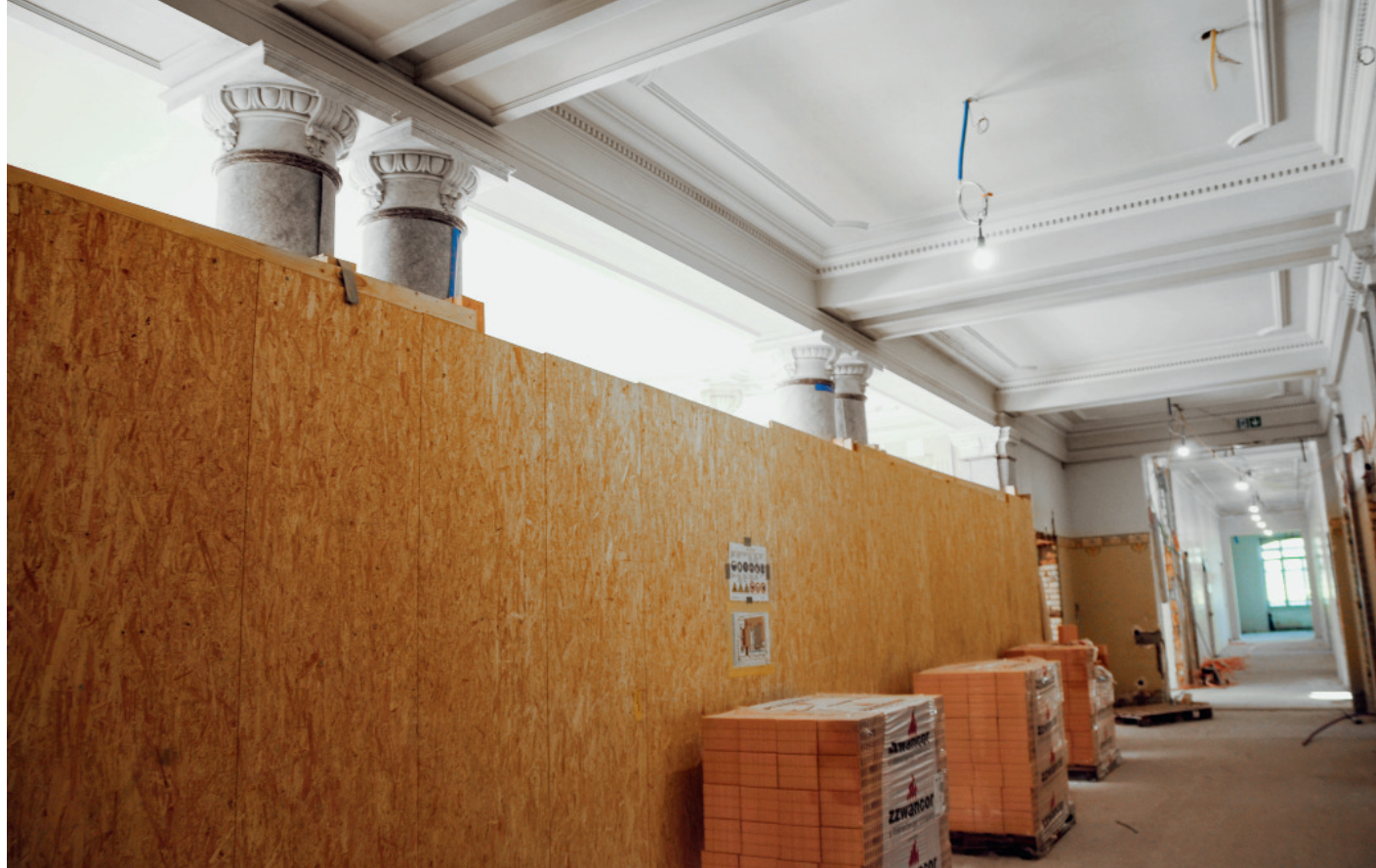
Blick in den Korridor des Verwaltungsgebäudes von 1901. Sowohl an der Gebäudehülle und der Umgebung als auch im Inneren galt es, die historische Bausubstanz sorgfältig zu sanieren und während der Umbauarbeiten vor Beschädigungen zu schützen.

Zusammenarbeit mit den für Minergie-Eco und 2000-Watt-Areal spezialisierten Ingenieuren von Arup Deutschland GmbH und Intep Intergrale Planung GmbH für eine erfolgreiche Zertifizierung nötig.