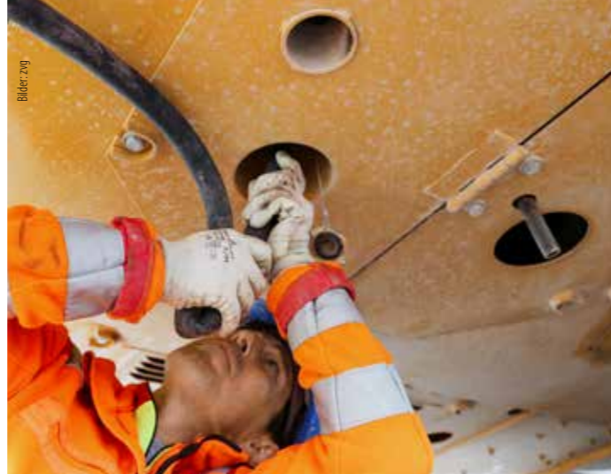
Der externe Wasseranschluss für die Berieselungsanlage wurde auf Wunsch der Keller Tiefbau AG anstelle eines Tanks eingebaut.