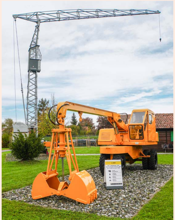
1949 erfand Hans Liebherr mit dem TK10 den mobilen Turmdrehkran (hinten). 1954 entwickelte er Europas ersten Mobilbagger, den L 300 (im Vordergrund) – und legte damit den Grundstein für den heutigen Weltmarktführer.

Als Hans Liebherr 1953 einen Seilbagger mietet, fällt ihm das Missverhältnis zwischen Gewicht und Leistung auf. Acht Monate später präsentiert er mit dem L300 den ersten mobilen Hydraulikbagger Europas . Dieser ist nur 7,5 Tonnen schwer und damit viermal leichter als die angemietete Maschine. 1954 geht das für die damalige Zeit leistungsstarke Gerät mit 25 PS in Serie. Es ist die Geburtsstunde der heutigen Liebherr-Hydraulikbagger GmbH im baden-württembergischen Kirchdorf, in der Jahr für Jahr 3500 Maschinen auf einer Gesamtfläche von 43 Hektar produziert werden – rund 80 000 Stück bis zum heutigen Tag. (mgt/gd)