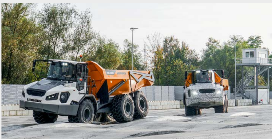
Schlaglöcher und Bodenwellen: Unter realitätsnahen Bedingungen wird den knickgelenkten Muldenkippern auf der Teststrecke einiges abverlangt.

«Weltweit werden im Maschinensektor die Produktzyklen immer kürzer», erläutert Martin Büche, der den Bereich Tests und Validierung am Kirchdorfer Liebherr-Werk leitet. «Und dieser Trend wird sich in den nächsten Jahren fortsetzen.» Dazu führten neue gesetzliche Rahmenbedin-