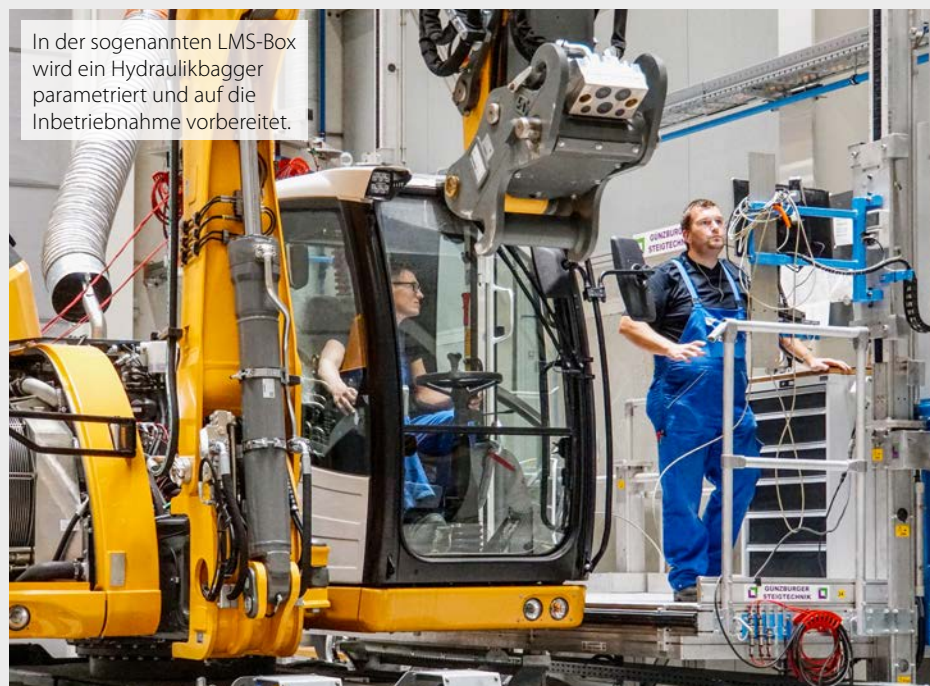
In der sogenannten LMS-Box wird ein Hydraulikbagger parametrisiert und auf die Inbetriebnahme vorbereitet.