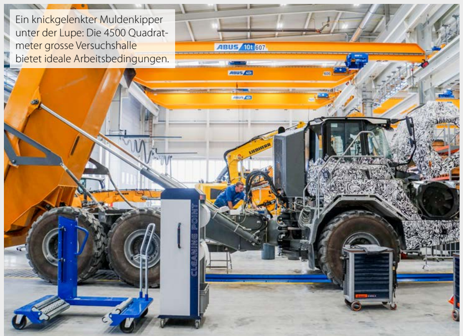
Ein knickgelenkter Muldenkipper unter der Lupe: Die 4500 Quadratmeter grosse Versuchshalle bietet ideale Arbeitsbedingungen.