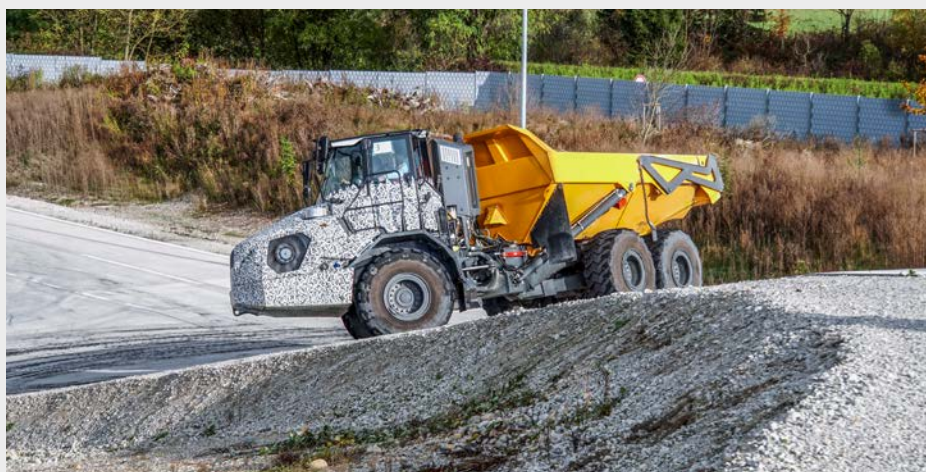
Auf dem Steigungshügel des Entwicklungs- und Vorführzentrums (EVZ) im süddeutschen Kirchdorf beweist der von Liebherr neu entwickelte ADT seine Wendigkeit.

Unter kontrollierten Bedingungen werden im EVZ die Fahrbedingungen auf ausgefahrenen Schotter- oder Erdpisten praxisnah simuliert, so wie sie später einmal in der Gewinnungsindustrie oder auf grossen Infrastrukturbauustellen anzutreffen sein werden. Egal ob kräftige Bodenwellen oder Schlaglöcher von 400 Millimetern