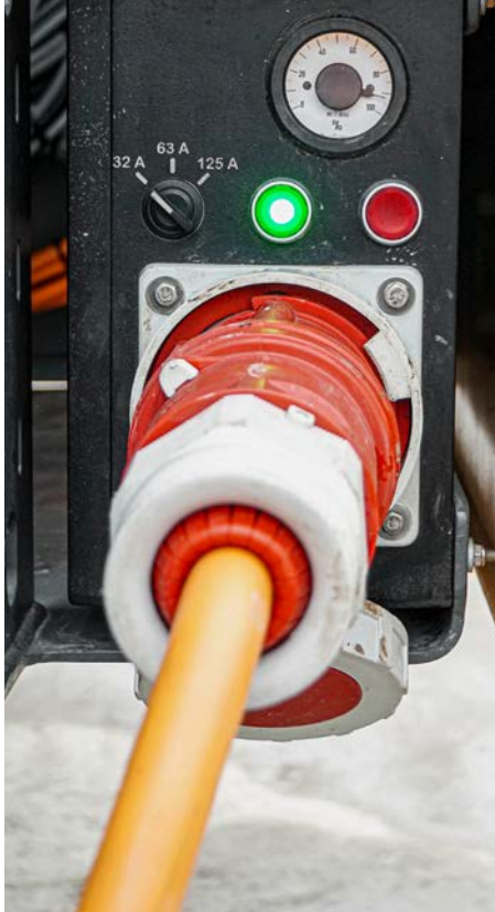
Der Akku lässt sich bequem via herkömmlicher Baustellenanschlüsse über Nacht aufladen.