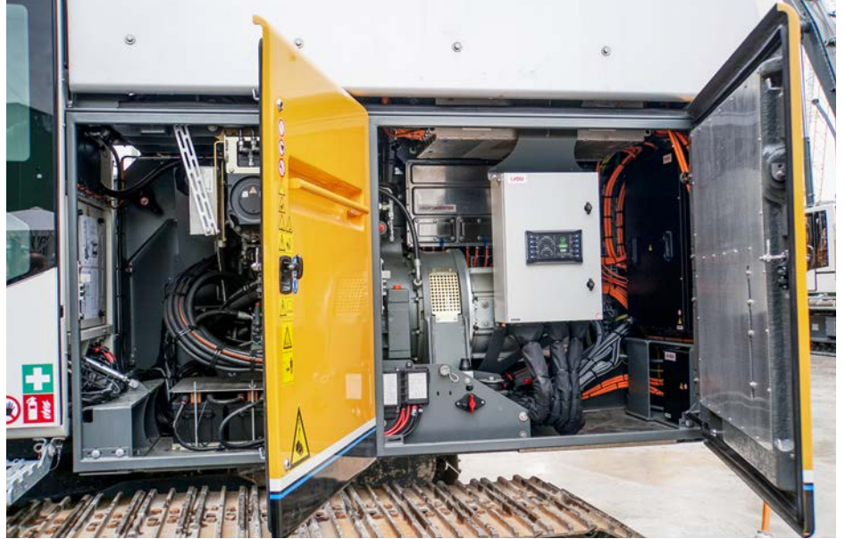
In künftigen Praxiseinsätzen sammeln die Liebherr-Ingenieure via Telematik fleissig Daten, um das «LB 16 unplugged» weiter zu optimieren.

unplugged» zudem mit seiner kompakten Bauweise, an der auch die Akku-Aufbauten nichts ändern.