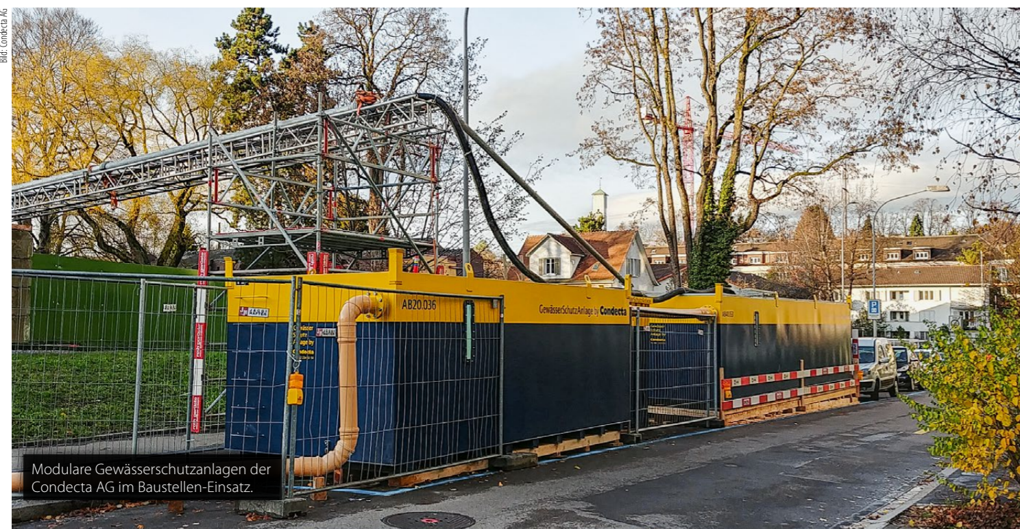
Modulare Gewässerschutzanlagen der Condicta AG im Baustellen-Einsatz.

Die Gewässerschutzanlagen sind mit moderner Überwachungstechnik ausgestattet, die den Betrieb und die Dokumentation der Daten vereinfacht. Wo erfolgt die Überwachung und wer übernimmt die Auswertung und Aufbereitung der Daten?