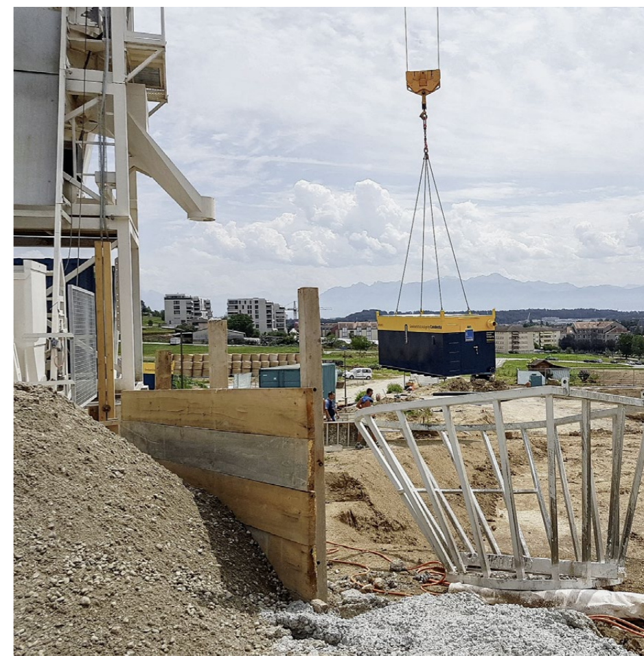
Mit dem Kran kann die Gewässerschutzanlage schnell und optimal platziert werden.

Die regelmässige Wartung wird von uns angeboten, ist allerdings meistens nicht notwendig. Die Anlagen sind so konzipiert, dass die nötige Wartung wie das monatliche Kalibrieren der Sonden von einem Verantwortlichen vor Ort vorgenommen werden kann. Alarmmeldungen werden vom zuständigen Projektleiter kontrolliert, der bei Notwendigkeit Kontakt mit der Baustelle aufnimmt. Condicta