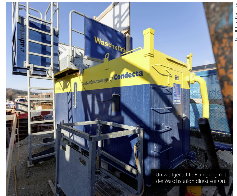
Umweltgerechte Reinigung mit der Waschstation direkt vor Ort.