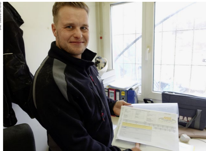
Jede Mischung wird von einzeln berechnet und bei Auslieferung mit den präzisen Daten dokumentiert. Zudem werden regelmässig Proben genommen und im Büro analysiert.

nationaler Forschungs- und Entwicklungsprojekte entwickelt und mitfinanziert wurde.