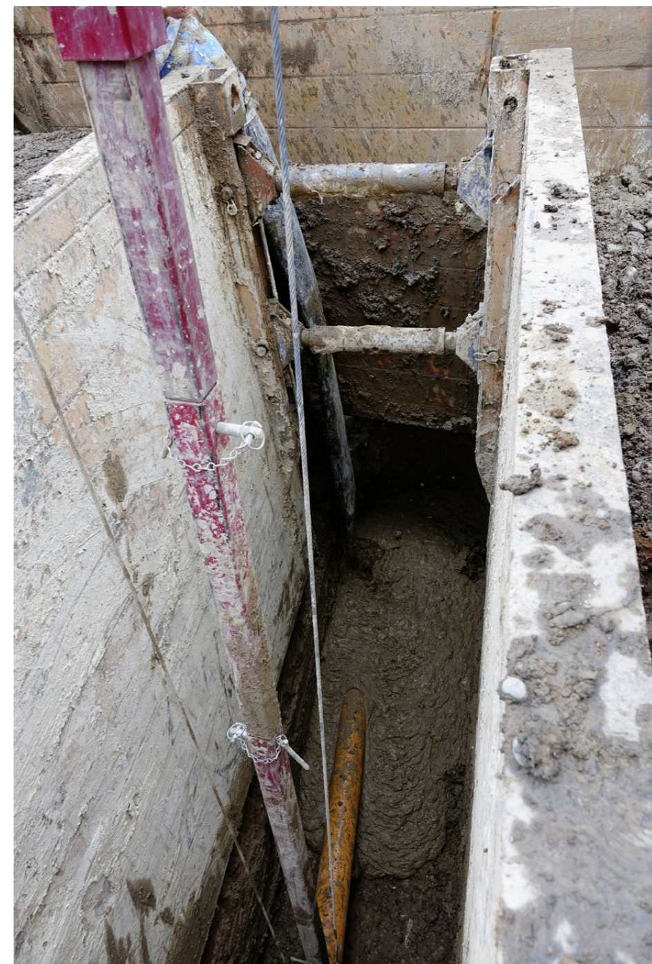
Gleichmäßig breitet sich der verfüllte Boden in der Baugrube aus und umschliesst die eingebauten Rohre vollständig. Eine zusätzliche Verdichtung ist nicht nötig.

glieder angehören. Seit diesem Zeitpunkt ist das Verfahren Basis der Anforderungen an schadensfreie Flüssigbodenanwendungen und Grundlage des RAL Gütezeichens 507. Mehrere tausend Projekte unterschiedlichen Umfangs wurden bereits in verschiedenen Ländern realisiert. Die technischen Voraussetzungen wurden im Forschungsinstitut für Flüssigboden GmbH, Leipzig, unter der Leitung von Olaf Stolzenburg geschaffen, wo das Verfahren im Rahmen zahlreicher deutscher und inter-