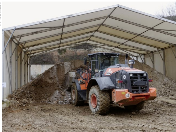
Das Aushubmaterial der Baustelle wird neben der Mischanlage zwischengelagert und dann für die Herstellung des Flüssigbodens geladen. Der Schaufelseparator des Radladers hält grobe Bestandteile zurück.