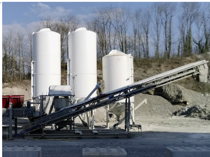
Mischanlage der RSS Flüssigboden Schweiz AG in Stein AG. Die Dosiereinheit wird mit Aushubmaterial befüllt. Compound, Zement und Kalk werden aus den Silos beigegeben.