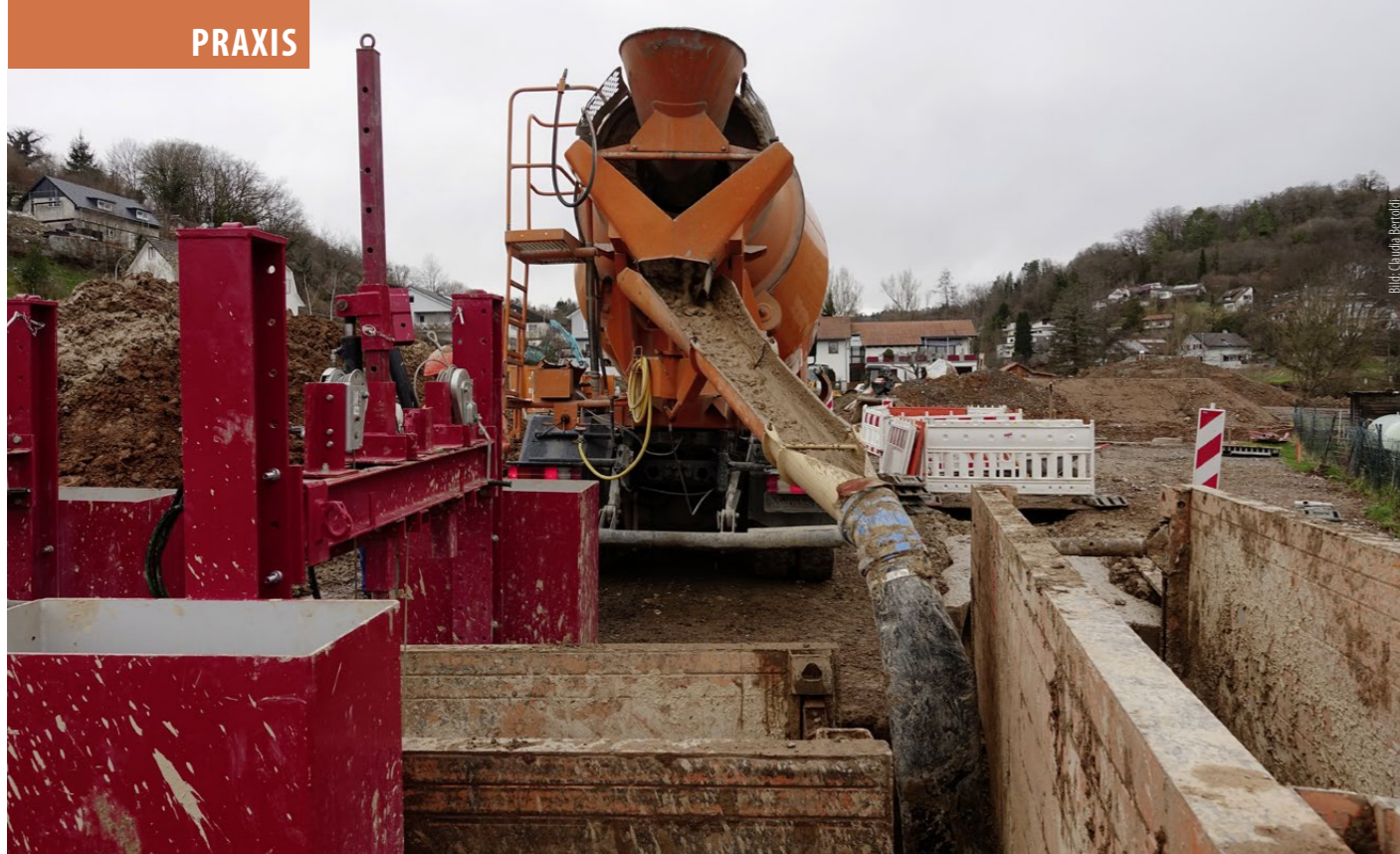
Flüssigboden-Einbau auf der Baustelle bei Rheinfelden AG.