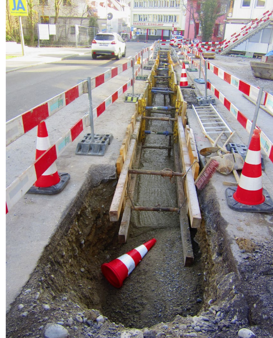
Verschiedene Anwendungen für Flüssigboden auf Schweizer Bautellen.

Inzwischen ist der Fahrmischer in der Mischanlage angekommen. Der Fahrer lenkt das Fahrzeug direkt unter das Ende des Förderbands der Anlage. Die Mischung des Materials kann jedes Mal entsprechend der gewünschten Bodeneigenschaften neu erstellt werden. Denn für Boden existieren keine festen, immer gleichen Eigenschaften. Diese können ausserdem auf Wunsch