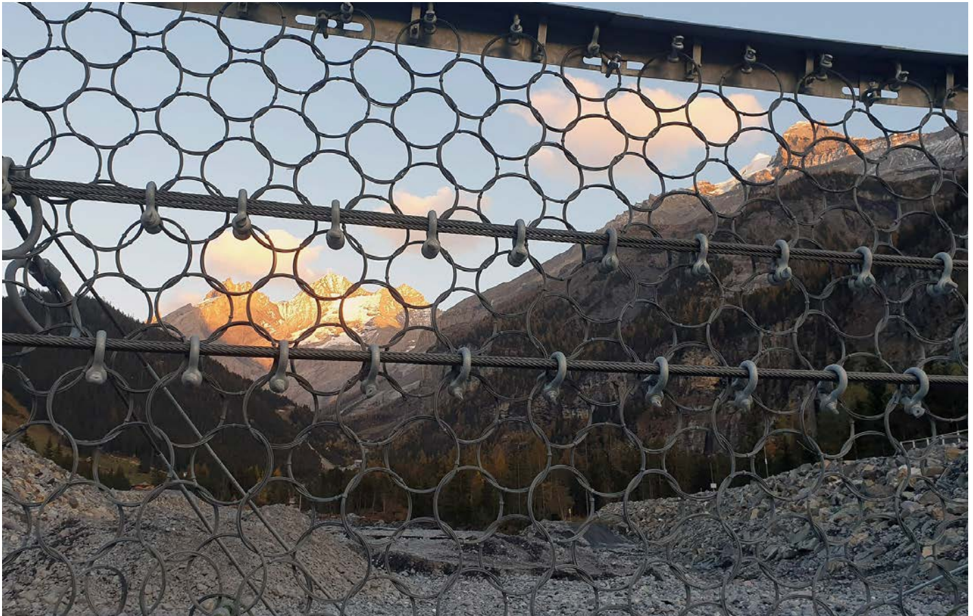
Das Bundesamt für Umwelt (Bafu) fungiert als Patronatspartner der neuen Fachmesse. Auch die Branchenorganisation Infra Suisse ist mit an Bord.