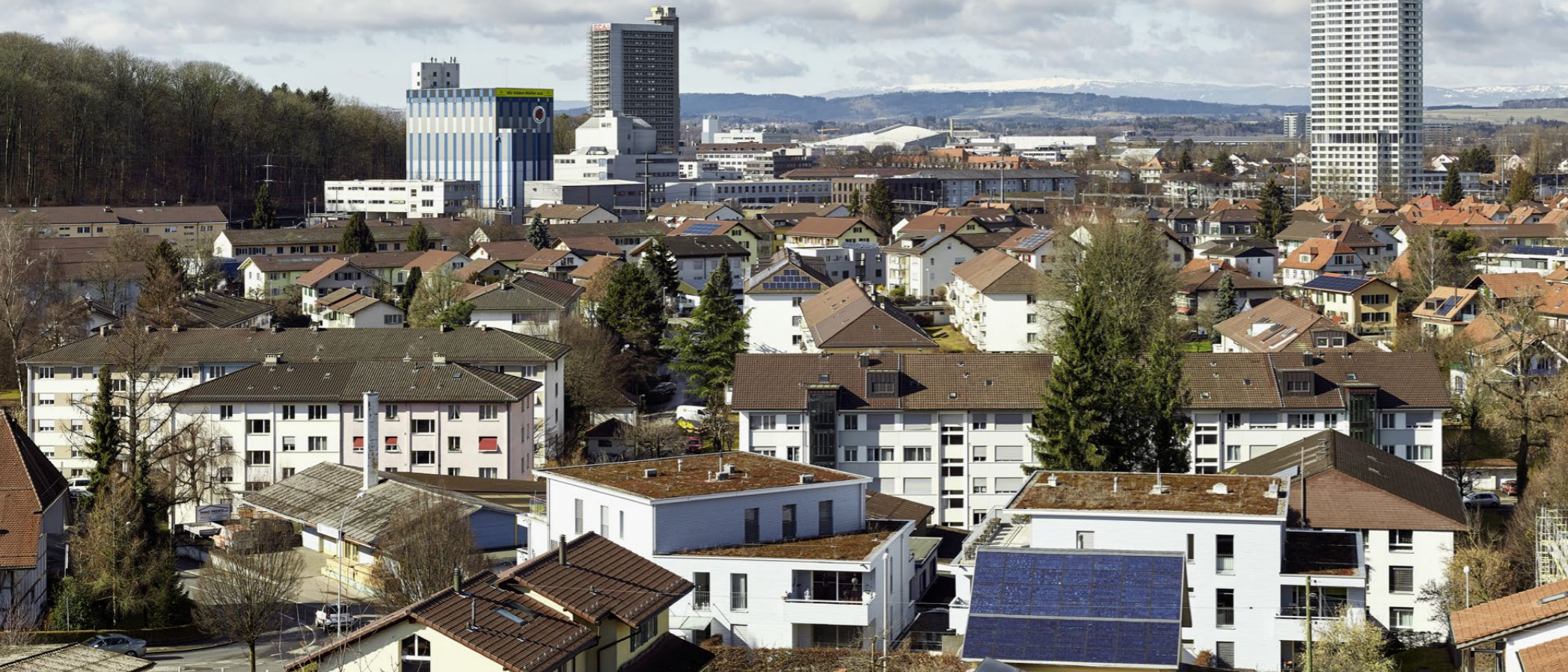
Blick auf Ostermundigen. Rechts im Bild der Bäretower.

Insgesamt 32 Stockwerke hoch ragt der Bäretower direkt neben dem Bahnhof von Ostermundigen in die Höhe. Noch ist das Hochhaus mit der filigranen Aluminiumfassade ein Solitär. Das Gebäudeensemble bildet den Auftakt zur geplanten baulichen Verdichtung am Stadtrand von Bern. Das Badener Architekturbüro Burkard Meyer realisierte den Wohnturm im Direktauftrag.