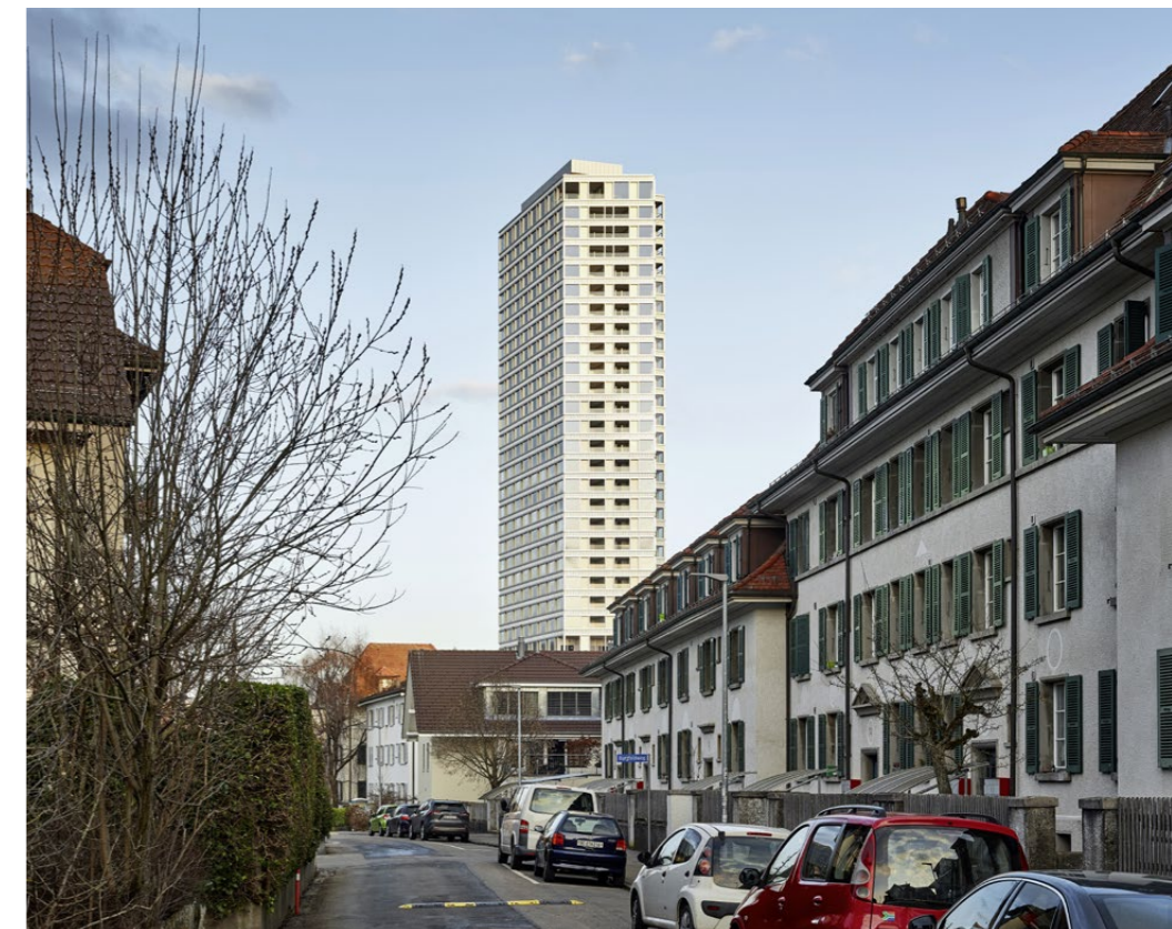
Mit dem Bäretower beginnt die bauliche Verdichtung am Stadtrand von Bern.

Gerippte, stranggepresste Elemente setzen Akzente in der Horizontalen, zwischen den Fenstern betonen Lisenen die Höhe der Geschosse. Die Fenster sind mal fassadenbündig festverglast, mal mit nach hinten versetzten Fensterflügeln versehen. Sie ergänzen das Spiel mit der Tiefe und prägen die Hülle reliefartig.