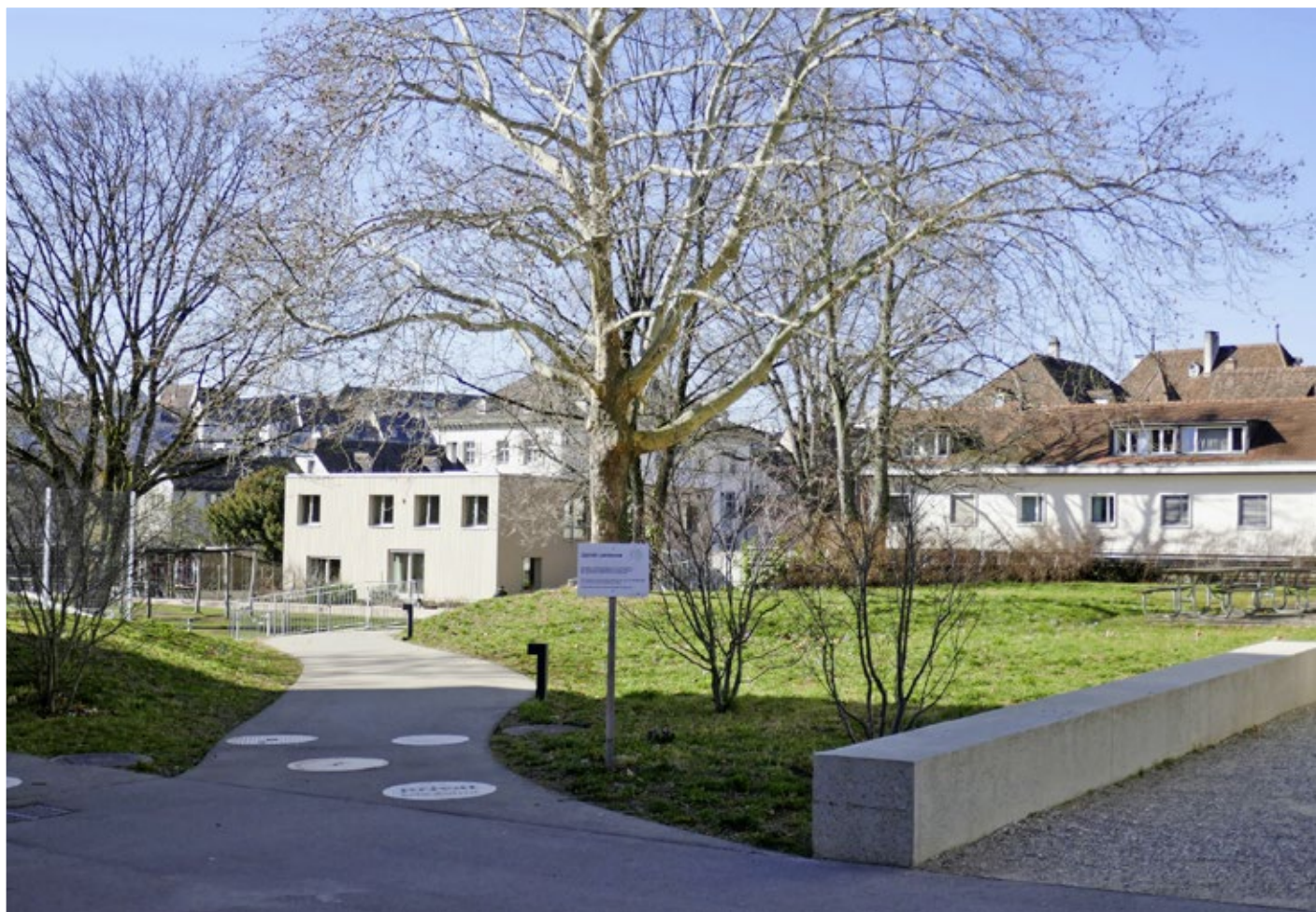
Der kubische Holzbau ist das neueste Gebäude auf dem Gelände. Er beherbergt eine Durchgangsgruppe.

Ein Inspektionsbericht aus den 1770er-Jahren enthält 26 Artikel mit Empfehlungen unter anderem zur Ernährung und Gesundheit der Kinder und zu baulichen Veränderungen. Der Vorschlag, den Waisenkindern im Winter eine Schüssel Mehlbrühe oder warme Milch zu geben, damit sie sich nicht den Bauch mit kaltem Wasser füllten, wurde abgelehnt. Die Kinder sollten nicht «verzärtelt» werden. Bei den Schlafräumen erfolgten immerhin gewisse Verbesserungen. Die Inspektoren hatten bemängelt, diese seien derart niedrig, dass die Kinder keine frische Luft, sondern