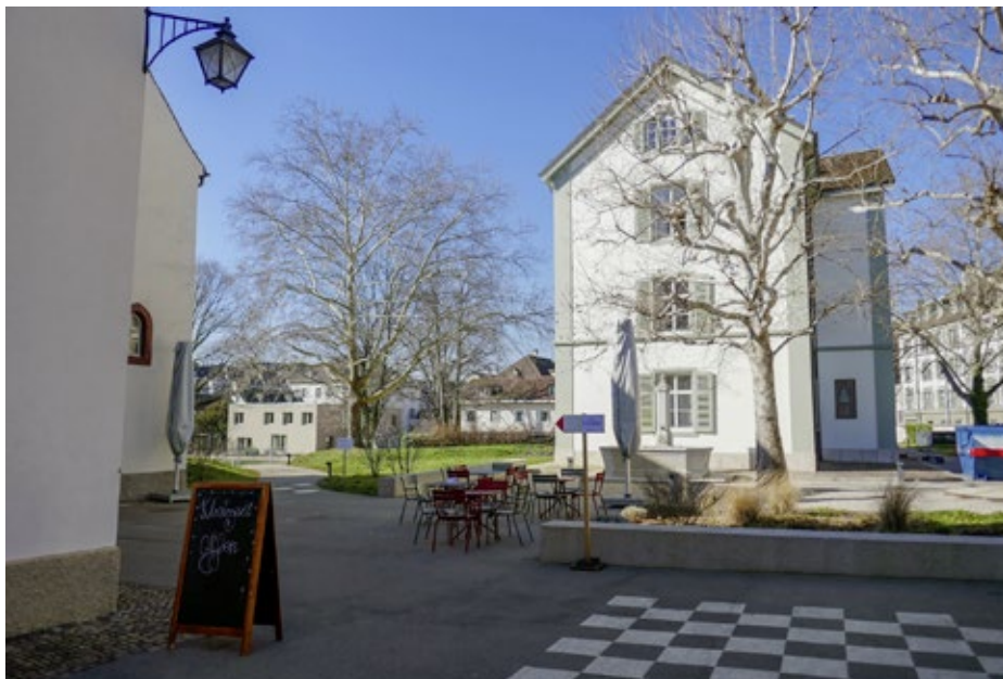
Vorne links das öffentliche Café in der ehemaligen Sakristei, rechts das frühere Kinderhaus.

Das Waisenhaus war trotz der anfangs tristen Bedingungen ein Fortschritt. Vor seiner Einrichtung wurden basel-städtische Waisenkinder ans «tägliche Almosen» gewiesen oder «ans Brot» – sie wurden lediglich mit Nahrung versorgt. Um ihre Erziehung kümmerte sich niemand. Lediglich «moralisch verkommene» Kinder und Jugendliche wurden vom Basler Rat ins Spital gewiesen. Wenn sie sich als gar zu renitent erwiesen, mussten sie in Ketten gelegt arbeiten. Im Spital war eine «Kindermutter» angestellt, die sich um die leiblichen Bedürfnisse