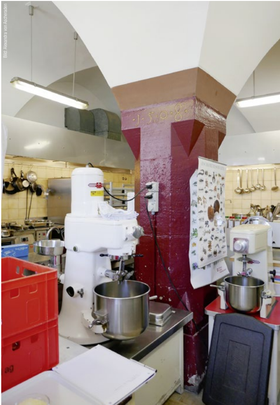
Die Küche von 1508 hat ein wunderbares Kreuzgewölbe, aber auch viele Stufen.

nur ihre eigenen Ausdünstung einatmen könnten. Deshalb sollten die Decken erhöht, Luftlöcher oder Fensteröffnungen eingebaut werden. Immerhin zu Luftlöchern mochte man sich dann tatsächlich durchringen.