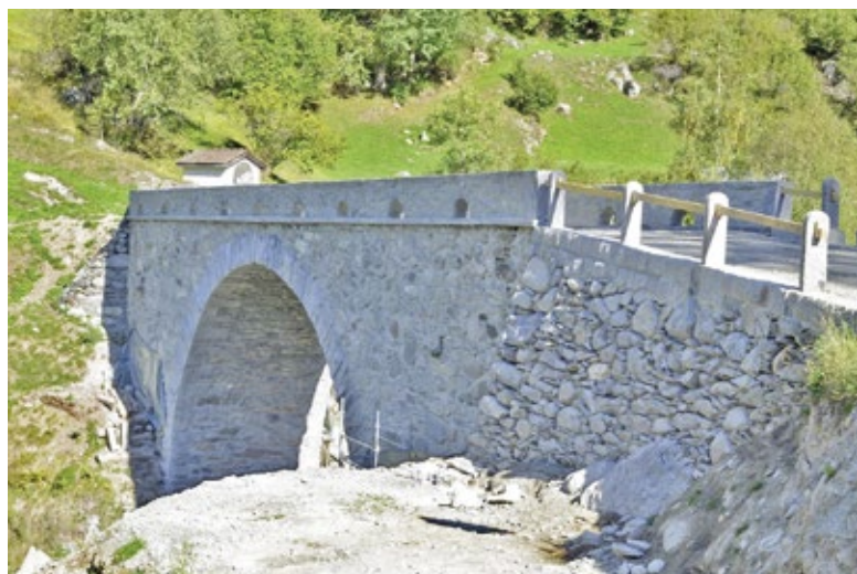
Die Punt Scangles Sut ist eine rund 150 Jahre alte Brücke, ein wertvoller historischer Teil der alten Lukmanierpassstrasse. Für die Arbeiten an Mauerwerk und Bogenuntersicht wurde Fixit 565 Rania Natursteinmörtel eingefärbt eingesetzt.

Semiflexibler Reparaturmörtel, vereint die Flexibilität und Fugenlosigkeit von Asphalt mit der Druckfestigkeit und anderen günstigen Eigenschaften von Beton. Dadurch können in kurz gehaltenen Sperrzeiten Schlaglöcher in Asphalt- bzw. Betonflächen schnell, einfach und dauerhaft beseitigt werden.