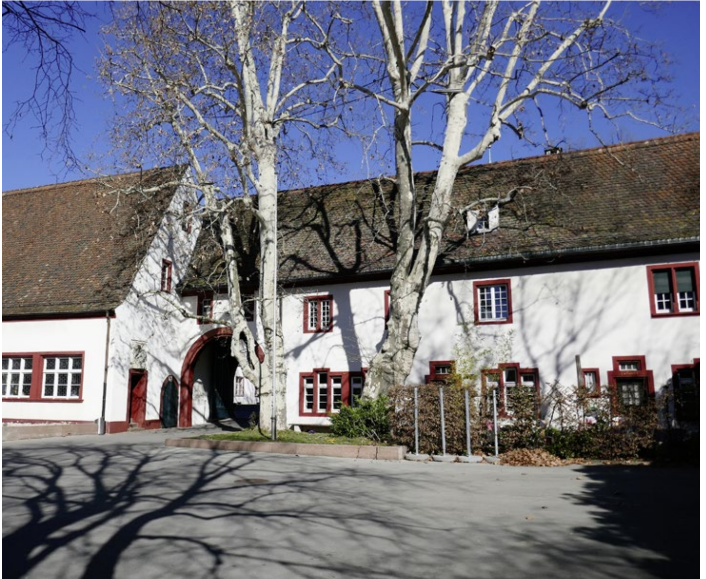
Der Eingang des Waisenhauses, Ansicht vom öffentlich zugänglichen Innenhof her.