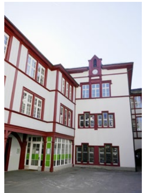
Das heutige Verwaltungsgebäude.