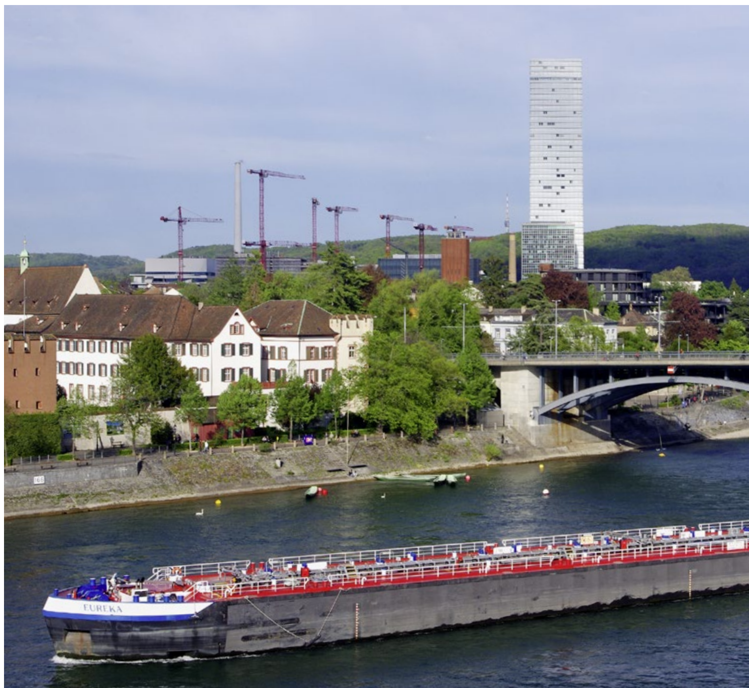
Blick vom Münster auf das Waisenhaus und die Wettsteinbrücke. Im Hintergrund das Roche-Hochhaus.

kümmerte. Ansätze einer pädagogischen Erziehung waren nicht vorgesehen.