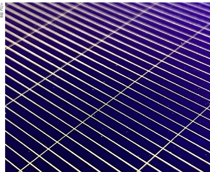
Die Leiterbahnen aus Kupfer sind mit 19 Mikrometer extrem dünn. Deshalb ist auch die Verschattung der lichtempfindlichen Siliziumschicht sehr gering.