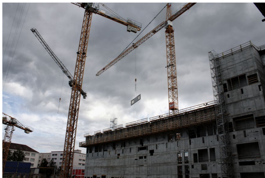
Die Baustelle der Messe Basel war aufgrund ihrer Stadtlage besonders anspruchsvoll.