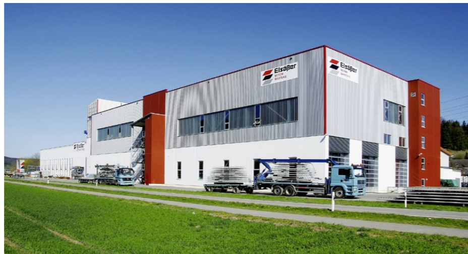
Diese Produktionshalle wurde 2006 in Betrieb genommen und am Standort der allerersten Halle aus dem Jahr 1972 aufgebaut, nachdem diese abgerissen war.