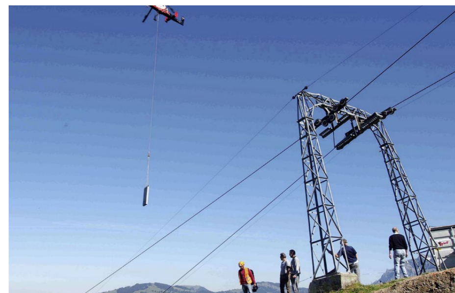
Manchmal wurden sogar per Hubschrauber Betonfertigteilelemente an Schweizer Baustellen geliefert.

Egon Elsässer Bauindustrie GmbH + Co. KG, Am Schmidengraben 1, D-78187 Geisingen, Tel. +49 770 4805 0, info@elsaesser-beton.de, www.elsaesser-beton.de