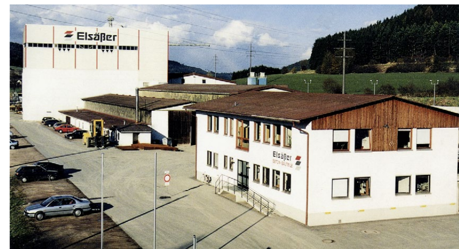
Ein Foto der Firmengebäude aus dem Jahr 1997. Das neue Verwaltungsgebäude im Passivhausstandard entstand 2014.

Beherrscht griff Egon Elsässer den Vorschlag auf, sich die Rente für das Auge auszahlen zu lassen und einen Kompagnon zu