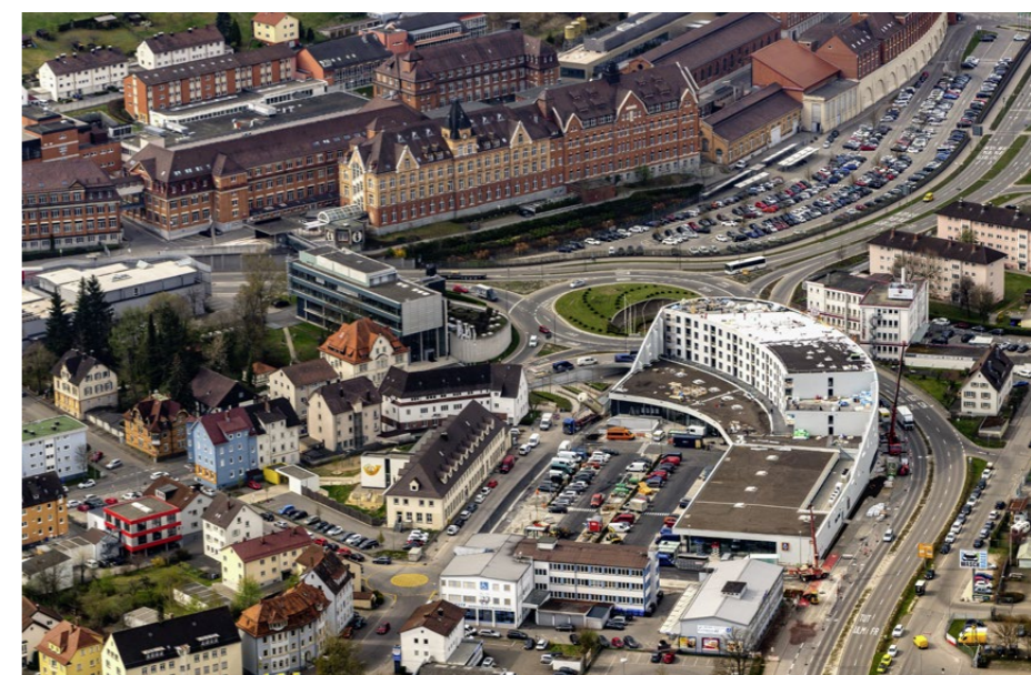
Auch elliptische Formen sind kein Problem: Für die Ausführung der Decken und Wände des Wohn- und Geschäftshauses am Aesculap-Platz in Tuttlingen wählte der Bauherr Betonfertigteile der Egon Elsässer Bauindustrie GmbH & Co. KG.