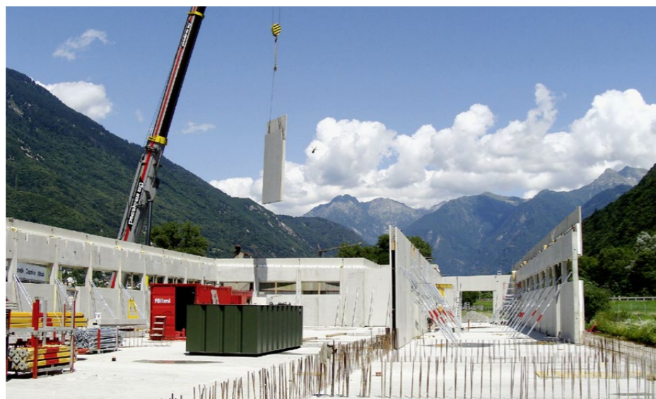
Baustelle des Aldi-Markts in Arbedo im Tessin. Der Rohbau wurde in nur drei Wochen erstellt.