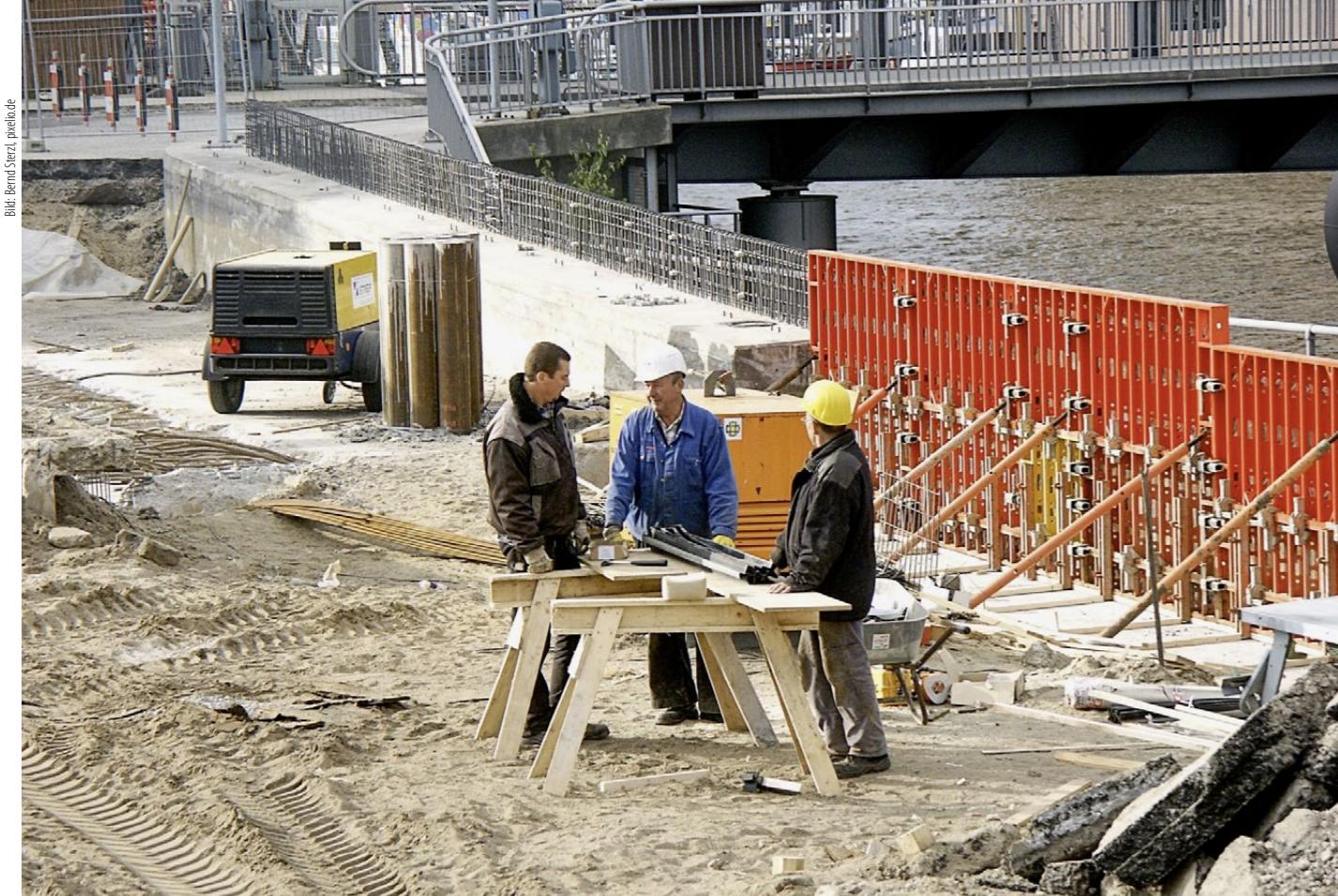
Bauherrschaft und Planer tragen gemeinsam die Verantwortung für ein nachhaltiges Bauen.