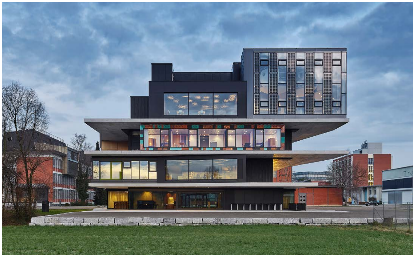
Die UMAR-Unit im Nest diente als Versuchsumgebung für die experimentelle Studie.