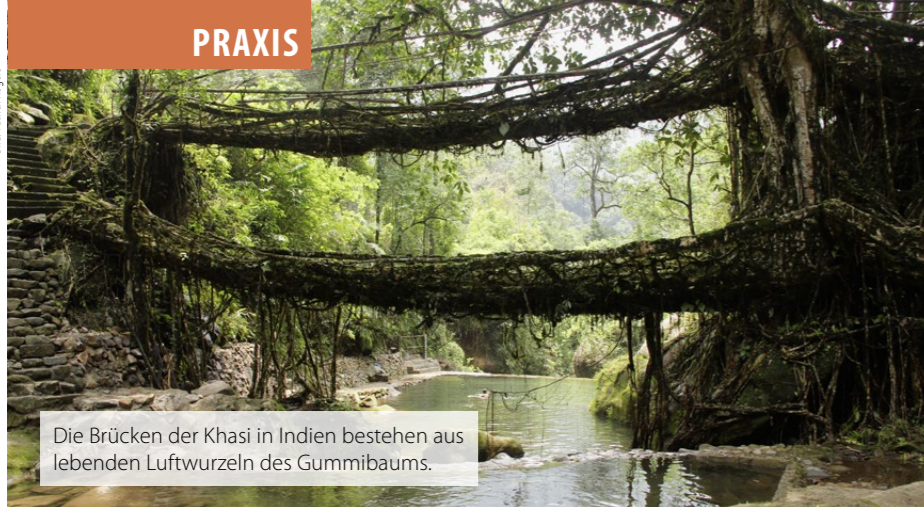
Die Brücken der Khasi in Indien bestehen aus lebenden Luftwurzeln des Gummibaums.

Wirkungen vor Ort: Die Bäume verschaffen dem Haus Kühlung und Beschattung. Zudem tragen sie zu einer angenehmen Atmosphäre in der Stadt bei durch ihre Verdunstung und Biodiversitätsförderung.