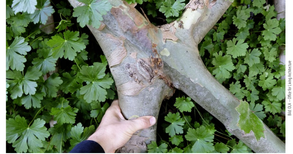
Kreuzverwachsung bei Platanen: Die jungen Bäume werden mit Stahlschrauben verbunden, die mit der Zeit in die Bäume einwachsen.

Tatsächlich glaube ich, dass die verschiedenen Ansätze zur Stadtbegrünung erst langsam die gebührende Aufmerksamkeit erhalten. Mit dem Bosco Verticale von Stefano Boeri in Mailand und anderen stadtbegrünenden Projekten sind die Möglichkeiten offensichtlich geworden und damit auch der Bedarf bei Investoren und in der breiten Bevölkerung. Lange war es nur ein «Nice to have». Aber mittlerweile ist der Groschen schon gefallen, dass wir eine Kühlung der Städte und deren Gebäude brauchen wegen der Anpassung an den Klimawandel. Dennoch ist die Skepsis immer noch gross. Sie brauchen stets jemanden, der etwas wagt, und einen Weg mitgeht, der ausserhalb der anerkannten Regeln der Baukunst liegt. Wir haben jetzt gerade ein