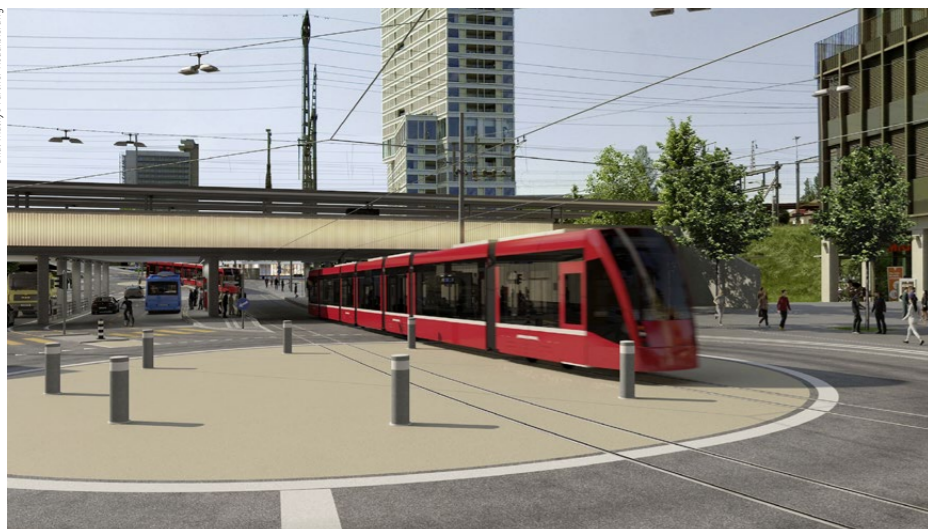
Umfangreiche Bauarbeiten stehen im Bahnhof Ostermundigen an. Die SBB baut diesen als ÖV-Knoten aus und schafft dabei auch Platz für das geplante neue Tram Ostermundigen.

Peter Füglistaler dürfte der Vollausbau bis 2035 realisiert sein.