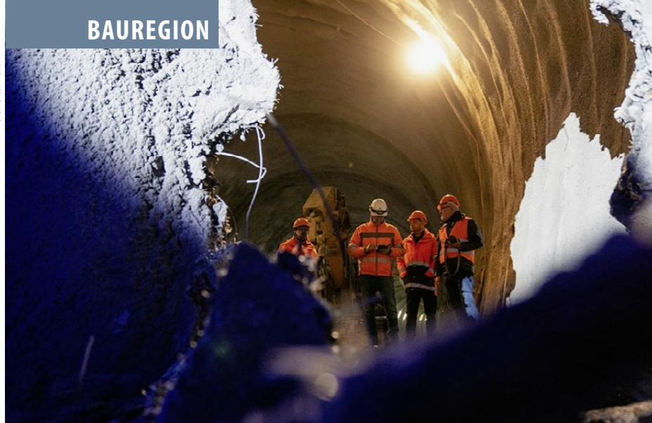
Nach fünf Jahren Bauzeit konnte im vergangenen November der Durchbruch im 657 Meter langen Umfahrungstunnel «Les Evouettes» gefeiert werden.

Gothard Bahn, im September gegenüber dem «Walliser Boten» sagte, hoffe er, dass alles im Kostenrahmen bleiben werde. Bei solchen Langzeitprojekten könne es aber immer Überraschungen geben. «In sieben Jahren werden sicher neue Anforderungen hinzukommen».