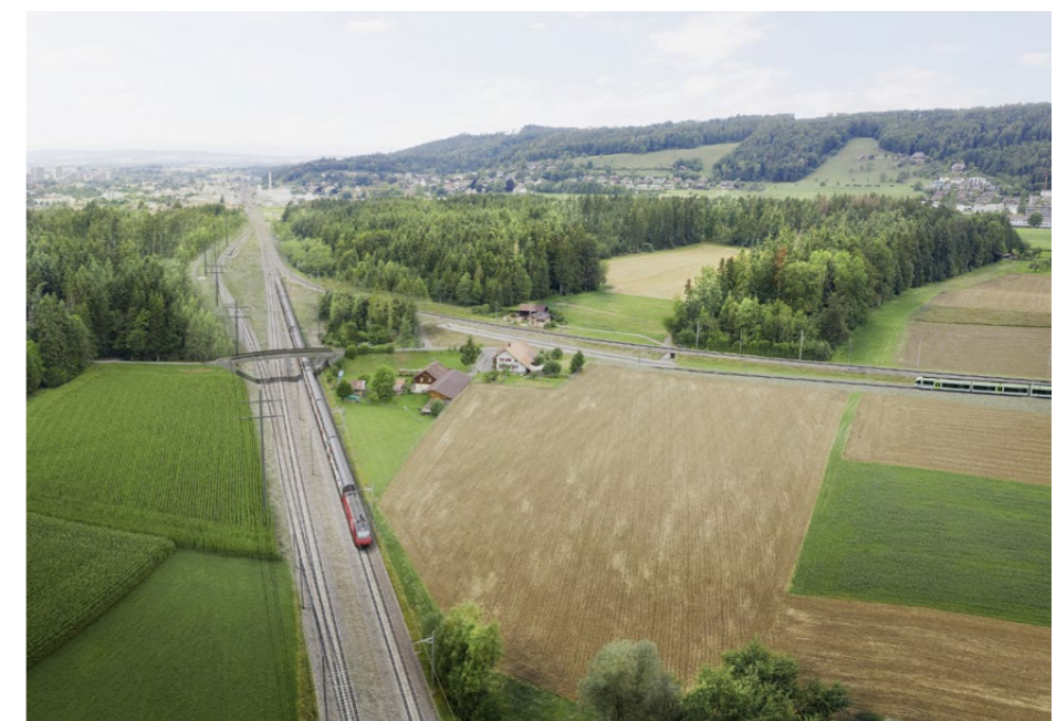
Mit der «Entflechtung Gümligen Süd» plant die SBB für rund 200 Millionen Franken einen 450 Meter langen Bahntunnel unter den Gleisen, um Kreuzungen der Züge zu ermöglichen.

Heute ist im Lötschberg-Basistunnel nur die Oströhre durchgängig befahrbar. Die Weströhre ist auf 14 Kilometern befahrbar, weitere 14 Kilometer sind ausgebrochen aber nicht ausgerüstet. Sieben Kilometer Fels müssen noch gebohrt werden. 2018 hatte das Parlament für den Teilausbau bereits 900 Millionen Franken bewilligt. Der Bundesrat beantragt dem Parlament nun weitere 640 Millionen. Laut BAV-Direktor