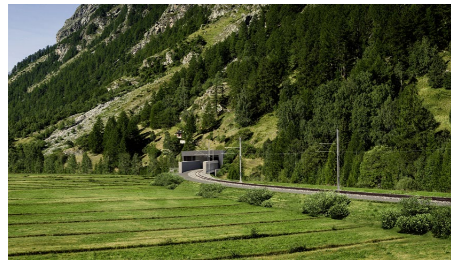
Mit dem 4,1 Kilometer langen Bahntunnel Unnerchriz zwischen Täsch und Zermatt plant die Matterhorn Gotthard Bahn für 400 Millionen Franken ihr bislang grösstes Infrastrukturprojekt.