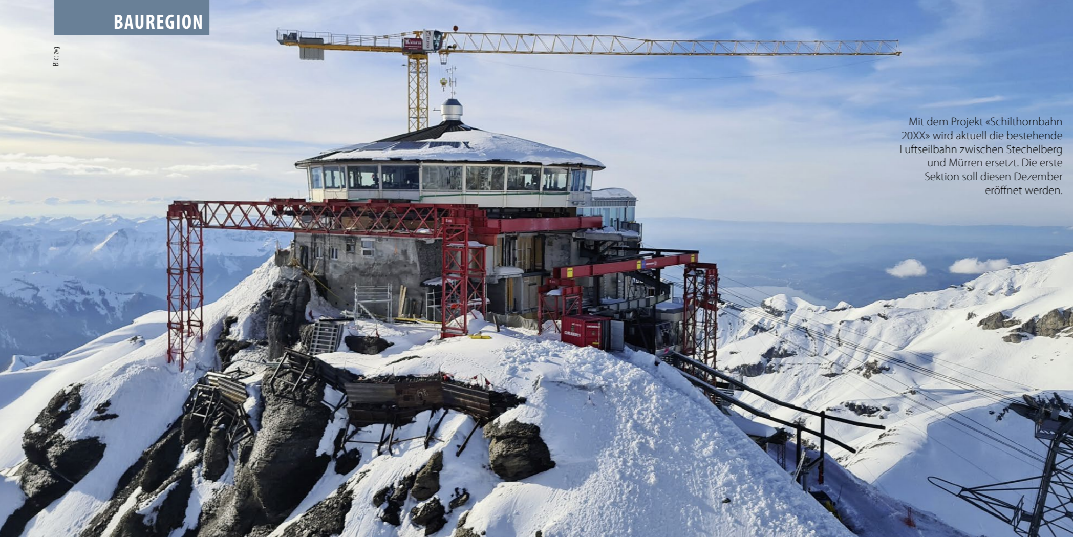
Mit dem Projekt «Schilthornbahn 20XX» wird aktuell die bestehende Luftseilbahn zwischen Stechelberg und Mürren ersetzt. Die erste Sektion soll diesen Dezember eröffnet werden.