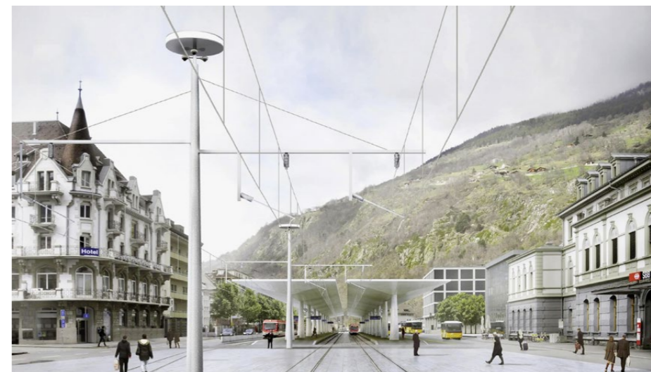
Mit dem «Generationenprojekt Bahnhof Brig» soll der überlastete Verkehr rund um den Bahnhof entflechtet und eine städtebauliche Entwicklung ermöglicht werden.

Für die Matterhorn Gotthard Bahn ist das Projekt in Brig nur eines von vielen. Denn mit dem Bahntunnel Unnerchriz plant sie für 400 Millionen Franken ihr bislang grösstes Infrastrukturprojekt. In gut zehn Jahren sollen damit Züge zwischen Täsch und Zermatt in einem rund 4,1 Kilometer langen Tunnel verkehren und sich zusätzlich in der Mitte auf einer 1,4 Kilometer