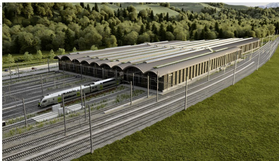
Mitte April lagen die Pläne für den Um- und Neubau der BLS-Werkstätte in Oberburg öffentlich auf. Die Gesamtkosten werden auf 277 Millionen Franken geschätzt.