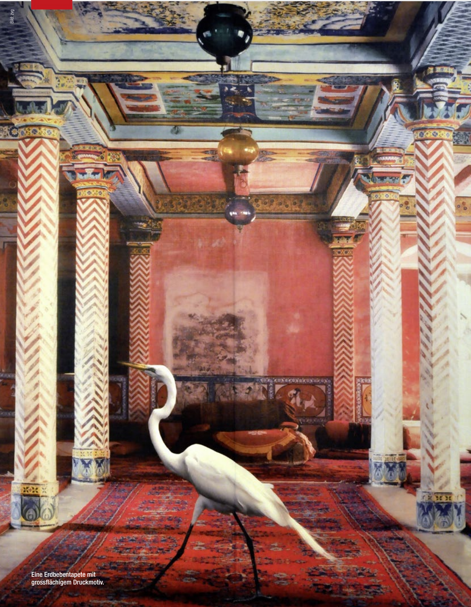
Eine Erdbebentapete mit grossflächigem Druckmotiv.