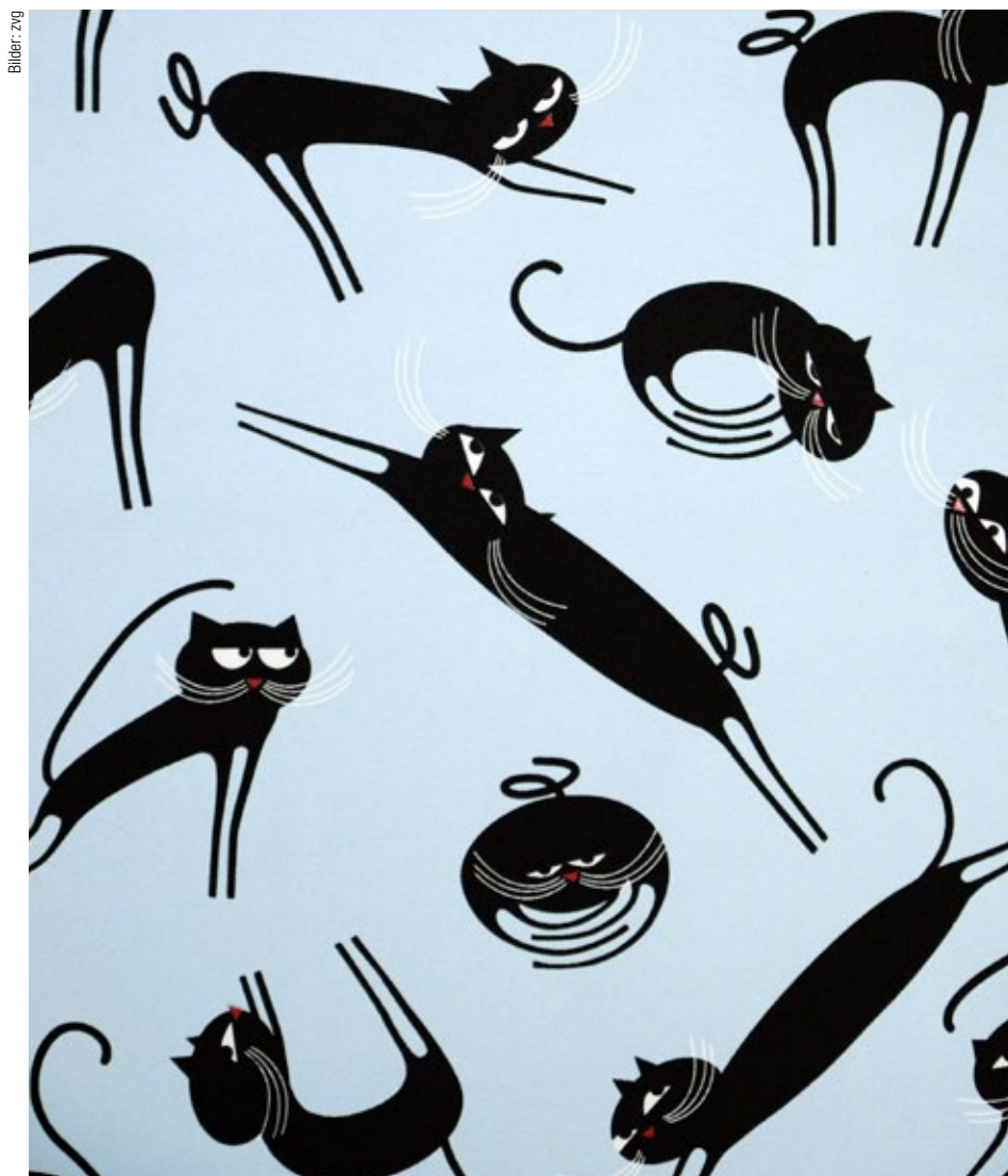
Phosphoreszierende Tapete: Nachts leuchten nur die Augen der Katzen.

kern. Da waren sie noch überzeugt, bald eine Lösung zu finden.»