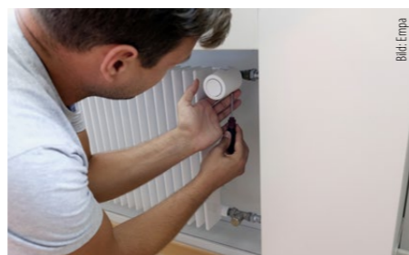
Der Wechsel von den herkömmlichen Heizkörper-Thermostatfühlern zu den Smart-Thermostaten «Danfoss Ally» ist einfach und in wenigen Sekunden möglich.

Und auch das Partnerunternehmen zeigt sich beeindruckt von den ersten Ergebnis-